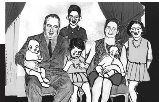
Spain Loves You de Isabel Herguera, 1988 © Isabel Herguera Ice Cream de Antoni Padrós, 1970 © Antoni Padrós

1980, 35 mm, couleur, 105', vo st anglais